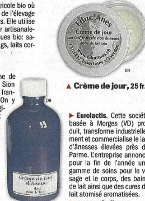
▲ Crème de jour, 25 fr.

► Crème pour le bain Educ'Anes, 19 fr.50