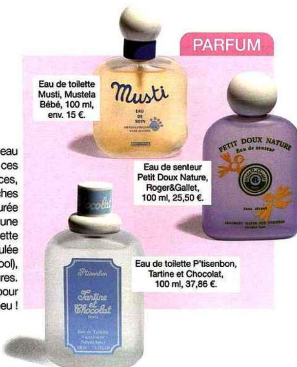
Eau de toilette Musti, Mustela Bébé, 100 ml, env. 15 €.

Sur une peau adulte, ces fragrances, douces et fraîches ont une durée de vie faible : une eau de toilette bébé (formulée sans alcool), tient deux heures. Suffisamment pour régresser un peu !