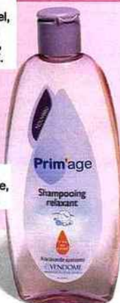
Shampooing relaxant, Prim'age, 300 ml, 2,70 €.

Les shampooings pour bébé ont souvent un pH trop alcalin pour les mamans. Ils risquent de provoquer un surgraissage du cuir chevelu et un assèchement des pointes. A partager ponctuellement.