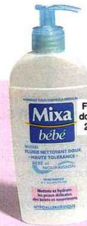
Fluide nettoyant doux, Mixa Bébé, 250 ml, 4,57 €.