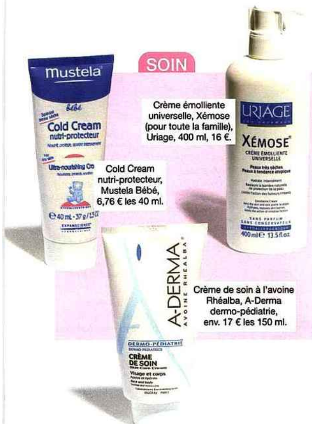
Crème émollente universelle, Xémose (pour toute la famille), Uriage, 400 ml, 16 €.