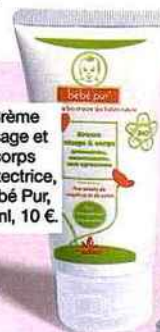
Crème visage et corps protectrice, Bébé Pur, 75 ml, 10 €.