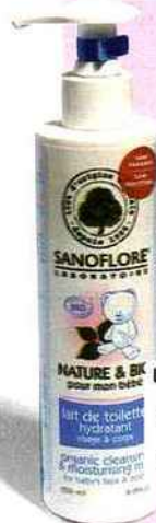
Lait de toilette hydratant Nature & bio, Sanoflore, 250 ml, 9 €.