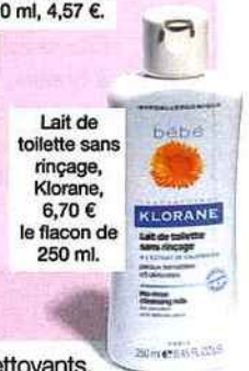
Lait de toilette sans rinçage, Klorane, 6,70 € le flacon de 250 ml.

On utilise les gels nettoyants, de préférence sans savon, et les eaux nettoyantes pour se rafraîchir et ôter les impuretés. On évite les produits trop gras si l'on a une peau à tendance acnéique.