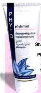
Shampooing doux, Phytomiel, Phyto, 100 ml, 10,20 €.